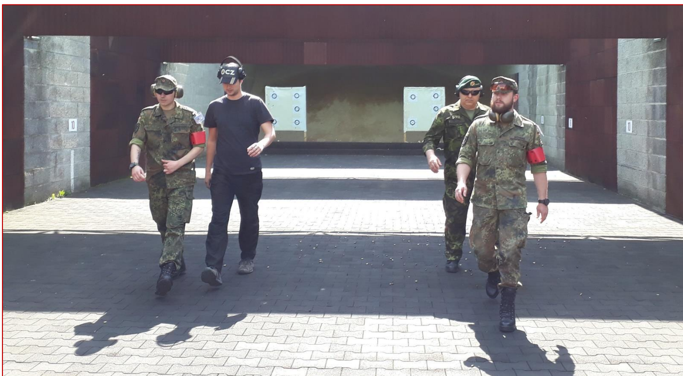
Obr. 1: Jedna z pistolových střelnic

Střelnice vybraná pro tuto soutěž byla prostorově a technologicky na vynikající úrovni s kompletním zabezpečením.